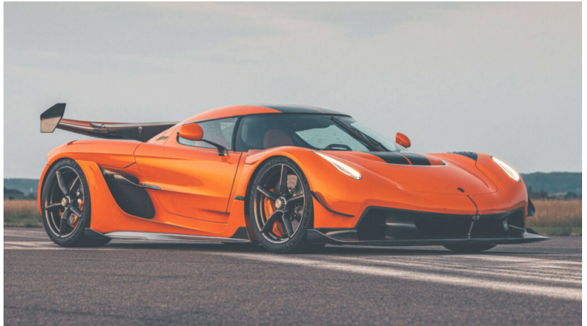
Für den Jesko von Koenigsegg sind wir als Serienlieferant für einige Baugruppen geführt

Du unterstützt uns im Bereich der Organisation und bekommst so Einblicke in alle Bereiche unseres Unternehmens. Vertrieb, Kundenbetreuung, Accounting - du wirst unsere Allzweckwaffe.